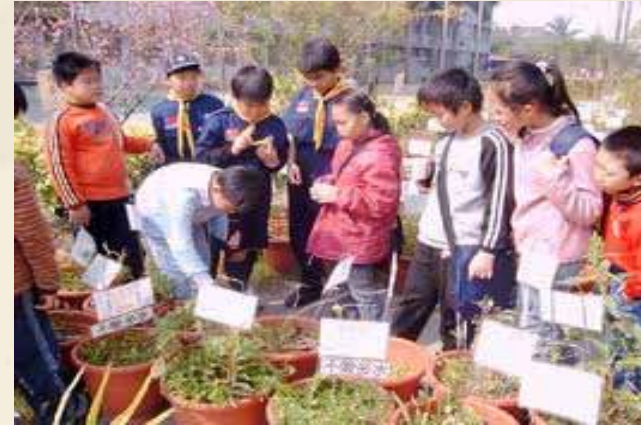
參觀和順國小藥草植物園