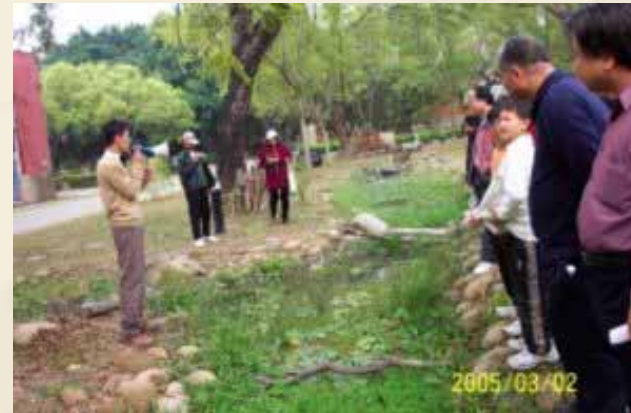
參觀嘉 南國小 人工生 態池景 觀