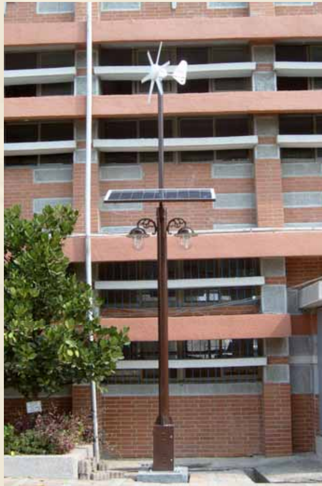
固定式太陽能系統及太陽能光