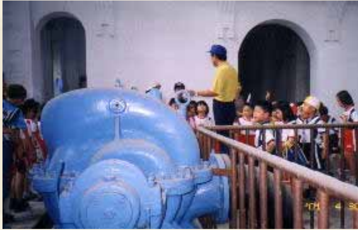
參觀 自來水廠 校外教學