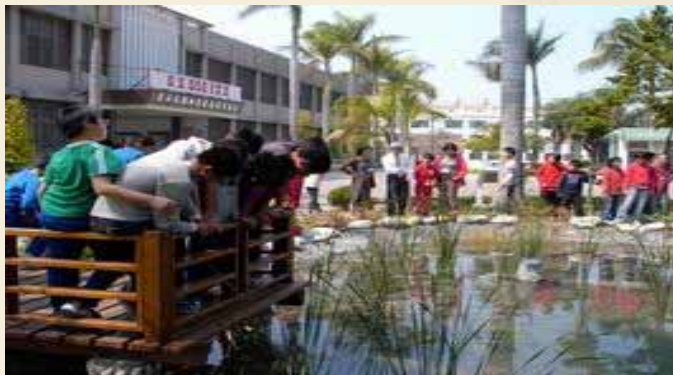
參觀安佃國小人工生態池