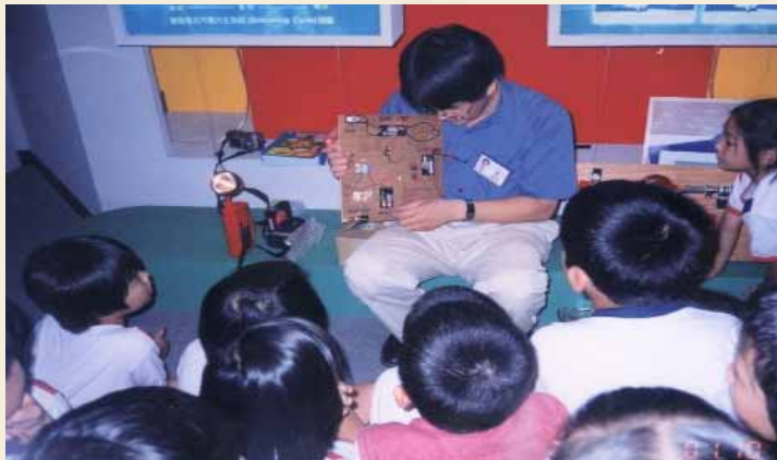
參觀 台電節約能源館