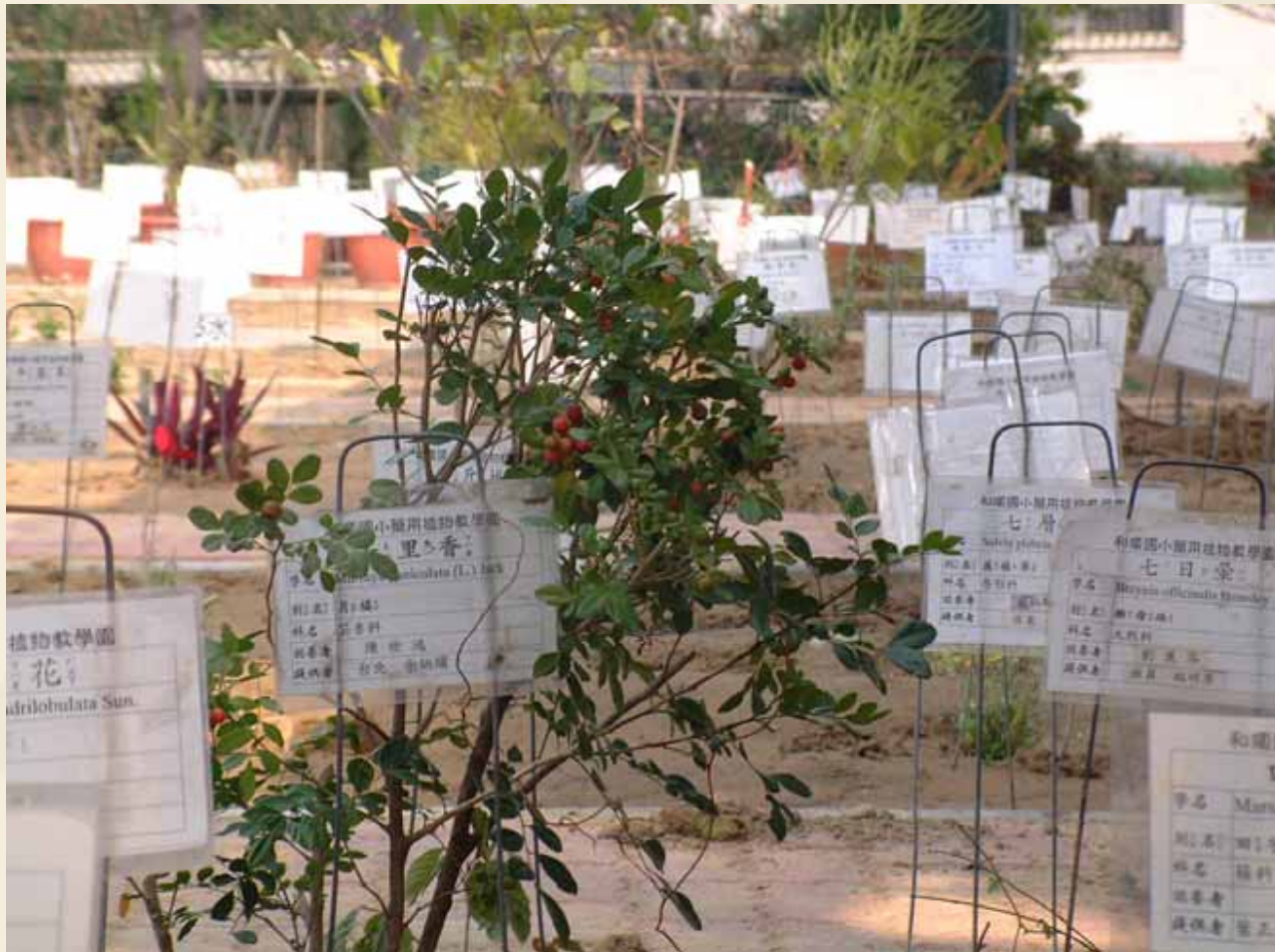
教學農園（藥草植物園）