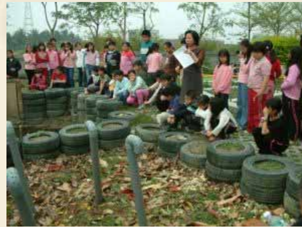
參觀長 安國小 垃圾堆 肥處理 場