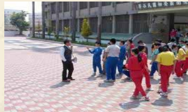
參觀安佃國小不透水鋪面