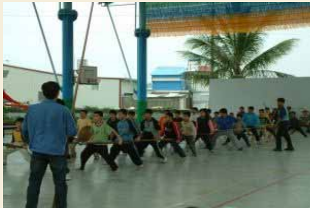
參觀安 田國小 風雨球 場設施 及宋江 陣演出