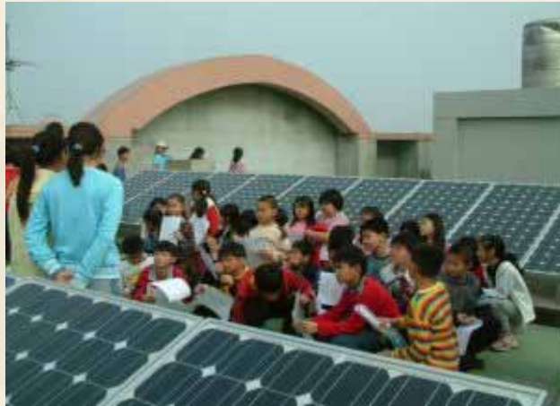
參觀安 順國小 太陽能 發電設 施