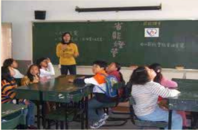
參觀安順國小省能設備及說明